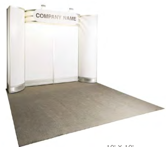
10' X 10'