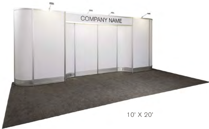
10' X 20'