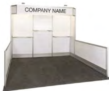
10' X 10'