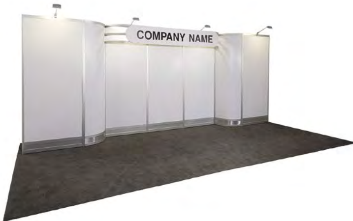
10' X 20'