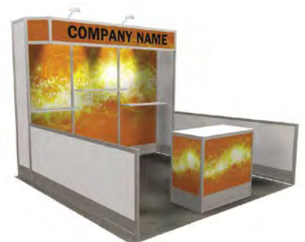
10' X 10'