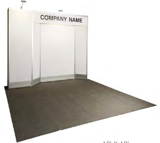
10' X 10'