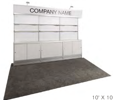
10' X 10'