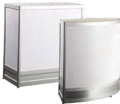
CABINETS | CABINETS