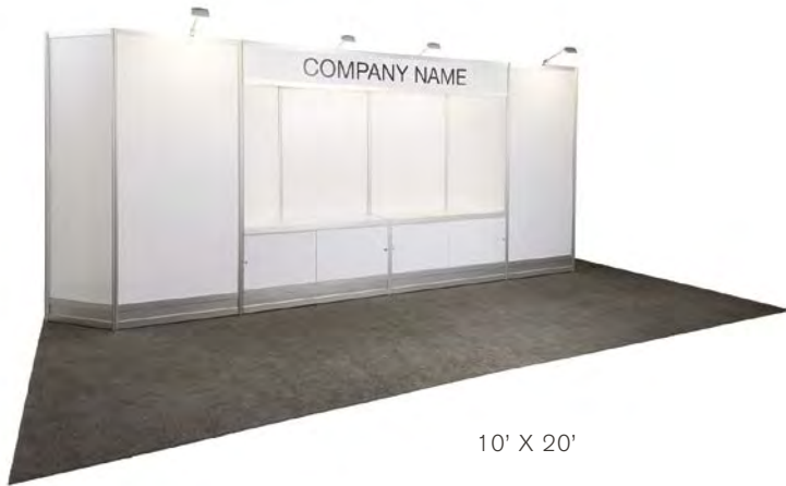
10' X 20'