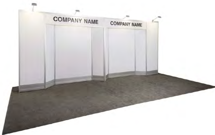
10' X 20'