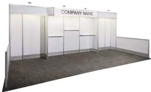
10' X 20'