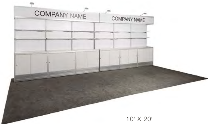
10' X 20'