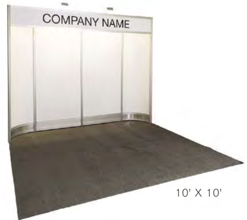
10' X 10'